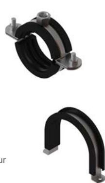
HPCL Boru Kelepçeleri