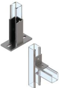
HC Profil Bağlantıları